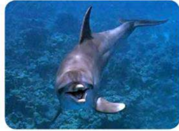
Posture mâchoire ouverte face à vous