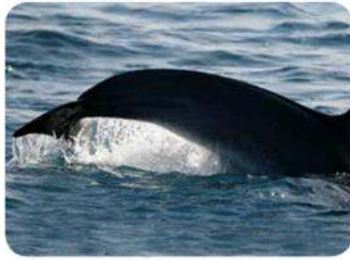
Dauphins frappant la surface de sa queue