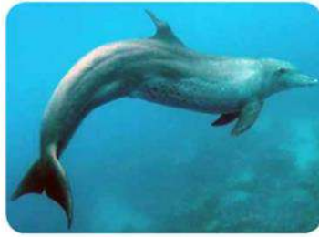
Posture en S